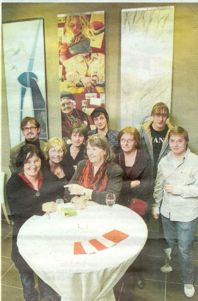
Don Bosco Mariaberg uit Essen en kunstacademie Sint-Lucas uit Kapellen werkten samen aan het kunstproject.

"Studenten van een BSO-afdeling laten samenwerken met leerlingen van het deeltijds kunstonderwijs, jonge adolescenten en volwassen leerlingen die achter een gemeenschappelijk cultuurproject staan, het was voor alle partijen een verrijkende ervaring", vertelt Uytdewilligen. Er werden drie tweedimensionele werken gemaakt die de verschillende richtingen van Sint-Lucas illustreerden: Mensen - olieverf en collage op doek -, De Boom - potlood op Japans papier -